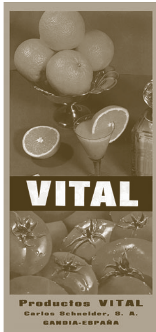
Anunci de Vital aparegut a diverses revistes de festes de Gandia, al llarg dels anys 1974-82.

res, en els embrions dels futurs cinturons industrials. Estructurat en tres grans blocs, el treball s'inicia amb la prehistòria de les indústries de conserves i derivats cítrics de la ciutat i dels empresaris pioners que forniren els antecedents directes de la Vital abans de la Guerra Civil. Segueix amb el que l'autor anomena la "història social i econòmica" de la companyia, traçant un recorregut des de la seua posada en marxa tot just estrenada la dècada dels 40 fins a la desaparició en l'any 2000, amb una especial atenció a la dècada dels seixanta, quan l'empresa fou capdavantera del que potser va ser el primer "miracle econòmic" espanyol, en el moment que el país eixia de l'autarquia i de l'aïllament