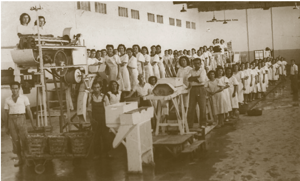
Imatge de l'interior de la Vital, any 1949. L'obtenció de suc de taronja era una tasca manual exclusiva de les dones, feta amb bancades de pinyes de mà durant molt de temps. Cada pinya correspon a un lloc de treball ocupat per una dona. Els homes s'ocupaven que no faltaren taronges en cap moment.