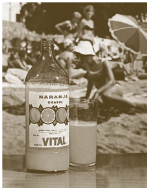
Anunci de Vital, anys setanta.