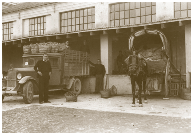
Els camions, però també els carros, eren utilitzats per al transport de la fruita.